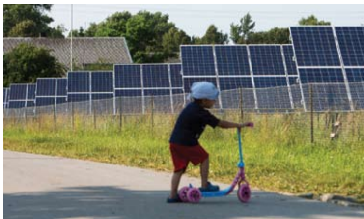
Vien infrastruktūros sutvarkymas, kad iškiltų savivaldybės saulės elektrinių parkas, energetikos bendrovių keliamais reikalavimais, kainuotų apie 5 milijonus eurų.

Anykščių rajono taryba nusprendė nebepardavinėti Kavarsko seniūnijos Šerių kaime esančio oro uosto – aerodromo nusileidimo tako. Anykščių rajono savivaldybė šio objekto teritorijoje statys savo saulės elektrinių parką.