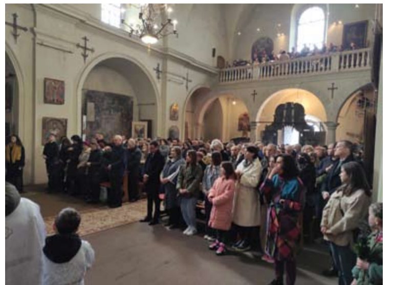
Per Verbų sekmadienio mišias buvusio vienuolyno bažnytelė pasitiko pilna tikinčiųjų.