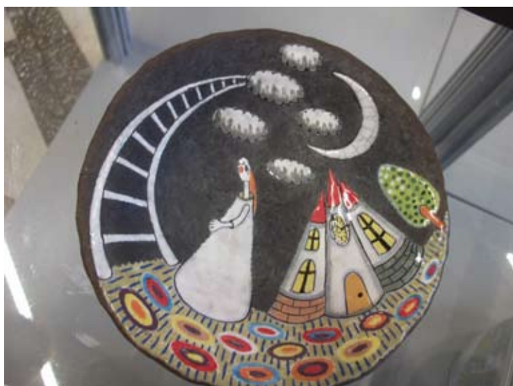
Linos Bekerienės dubenėlio dugne - laiptai į dangų.