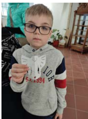
Vaikai rodė savo pagamintus angeliukus, tačiau nesišypsojo.